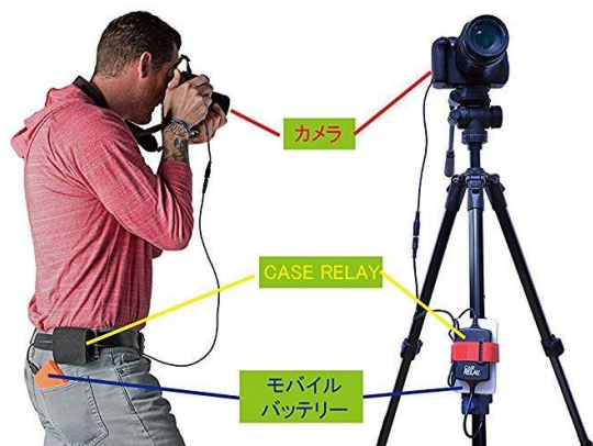
実際に使用するイメージ図

注1:DCケーブルが別売品であり、カメラのブランド及び型番により異なりますので、ご購入の際一度『適用カメラ&DCケーブル対応表』をご確認ください。 注2:上記イメージ図中のカメラ、DCケーブル、モバイルバッテリー及びUSBアダプターが本製品に含んでいない為、各自でご用意ください。