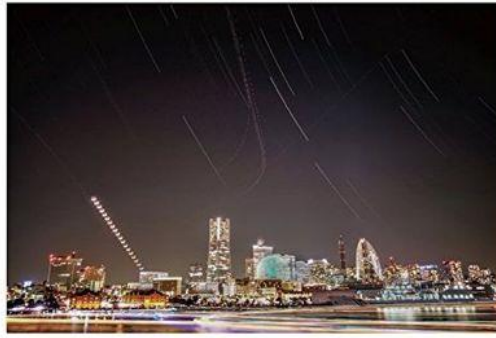
長時間の撮影で、途中にバッテリーの交換ができない場合

CASE RELAYを使えばデジタル一眼カメラの撮影で長時間使い続ける事が出来ます。 別売りのカメラ各機種対応のDCカプラーと併用する事で、USB接続からの給電が出来るため、 USB電源だけでなく大容量モバイルバッテリーからの給電が可能となります。 そのため、屋外でのタイムラプス撮影、長時間露光撮影の電源補助に最適です。