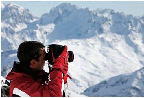
寒冷環境で、バッテリーの消費がしやすい場合

CASE RELAYを使えばデジタル一眼レフの撮影でも 様々なシーンで長時間使い続ける事ができ、安心です。